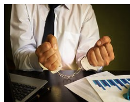
Оқибати аянчли бўлади!

маънавий-маърифий асослари” мавзусидаги “Коррупция сифатли таълимнинг кушандаси” мавзусида маъруза қилинди .