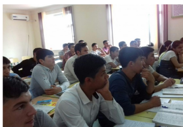
Учрашувлар самарали ўтди.

сменада семинар машғулотлари бўлиб ўтди. Семинарда режалаштирилган 416 нафардан 316 нафар иштирокчилар катнашдилар. 2019 йил 24 апрель кунини Андижон вилояти