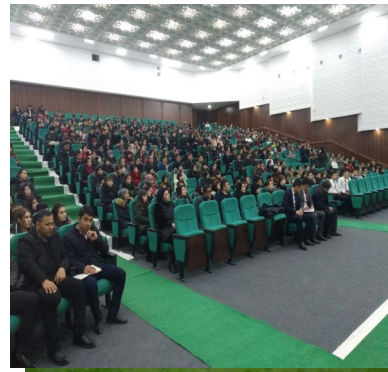
Сирдарё вилоятидаги учрашув лавҳаси.

Президентининг 2017 йил 2 февралдаги ПҚ-2752-сон қарори билан тасдиқланган “2017-2018 йилларга мўлжалланган коррупцияга қарши курашиш бўйича Давлат дастури”да белгиланган топшириқлар асосида коррупцияга қарши курашиш бўйича чора-тадбирлар режаси бўйича ишлар амалга ошириб келинмоқда.