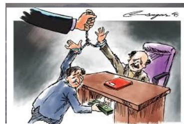
Коррупцияга қарши курашишни ўзимиздан бошлайлик!

“Коррупцияга қарши курашиш – барчамизнинг вазифамиз” мавзусида давра суҳбати ўтказилди.